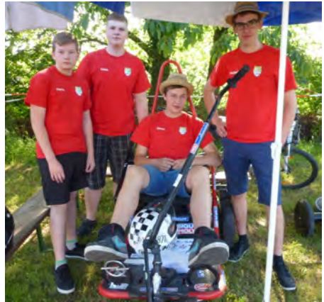
Siegermannschaft 2014: Landjugend Ketteldorf mit ihrem Bauernblitz