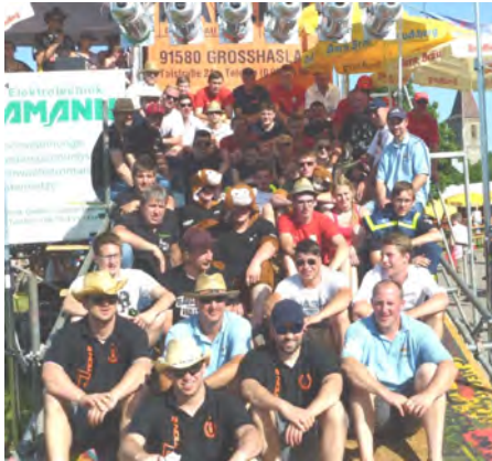
Gruppenbild der 50 Teilnehmer